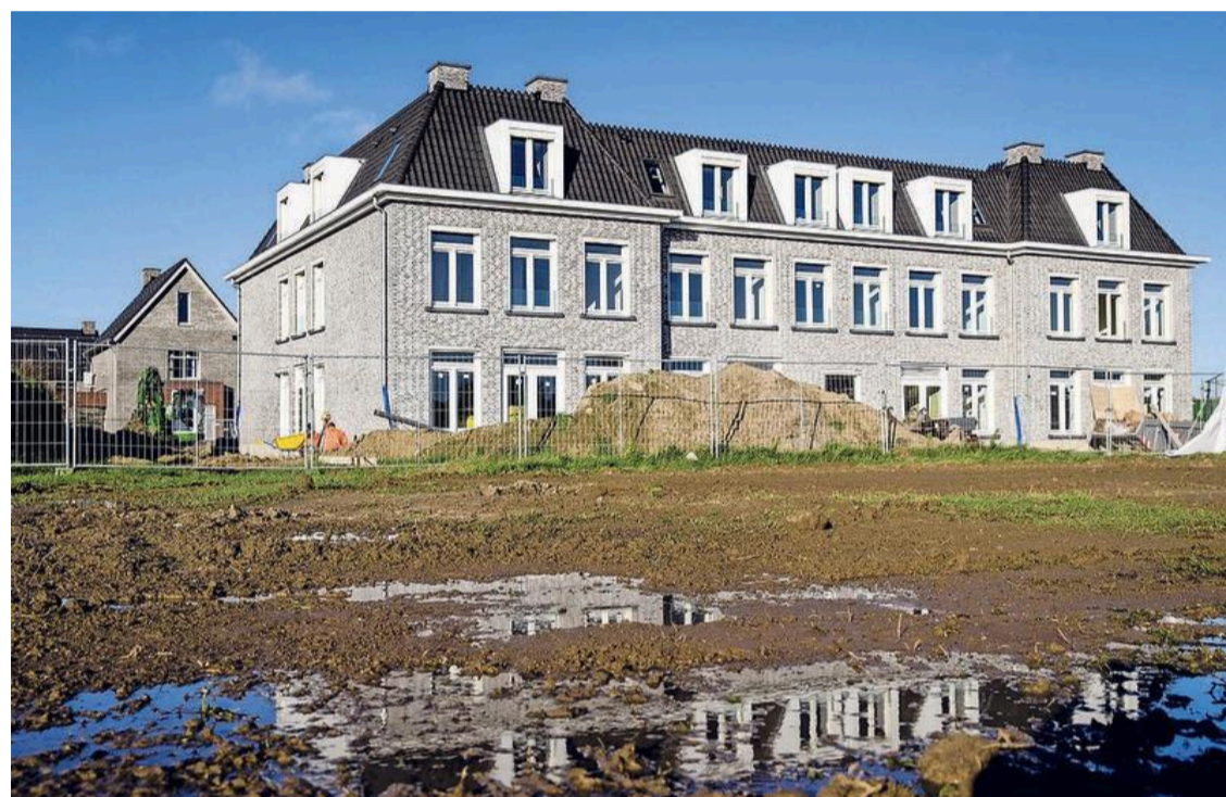
En complex met seniorenwoningen in aanbouw in het Limburgse Hertfen, dat onder de gemeente Roermond valt.