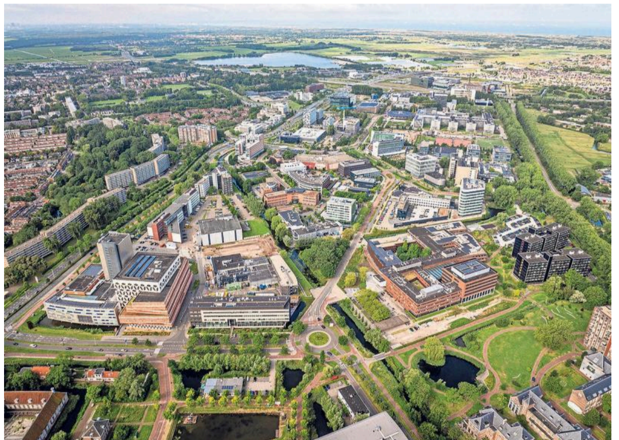
Het LBPS vanuit de lucht.

De drie Nederlandse bedrijven ontvingen in drie jaar tijd bijna tweehonderd miljoen euro van Odebrecht, volgens het OM. Daarvan mochten de bedrijven 4,5 procent houden als beloning.