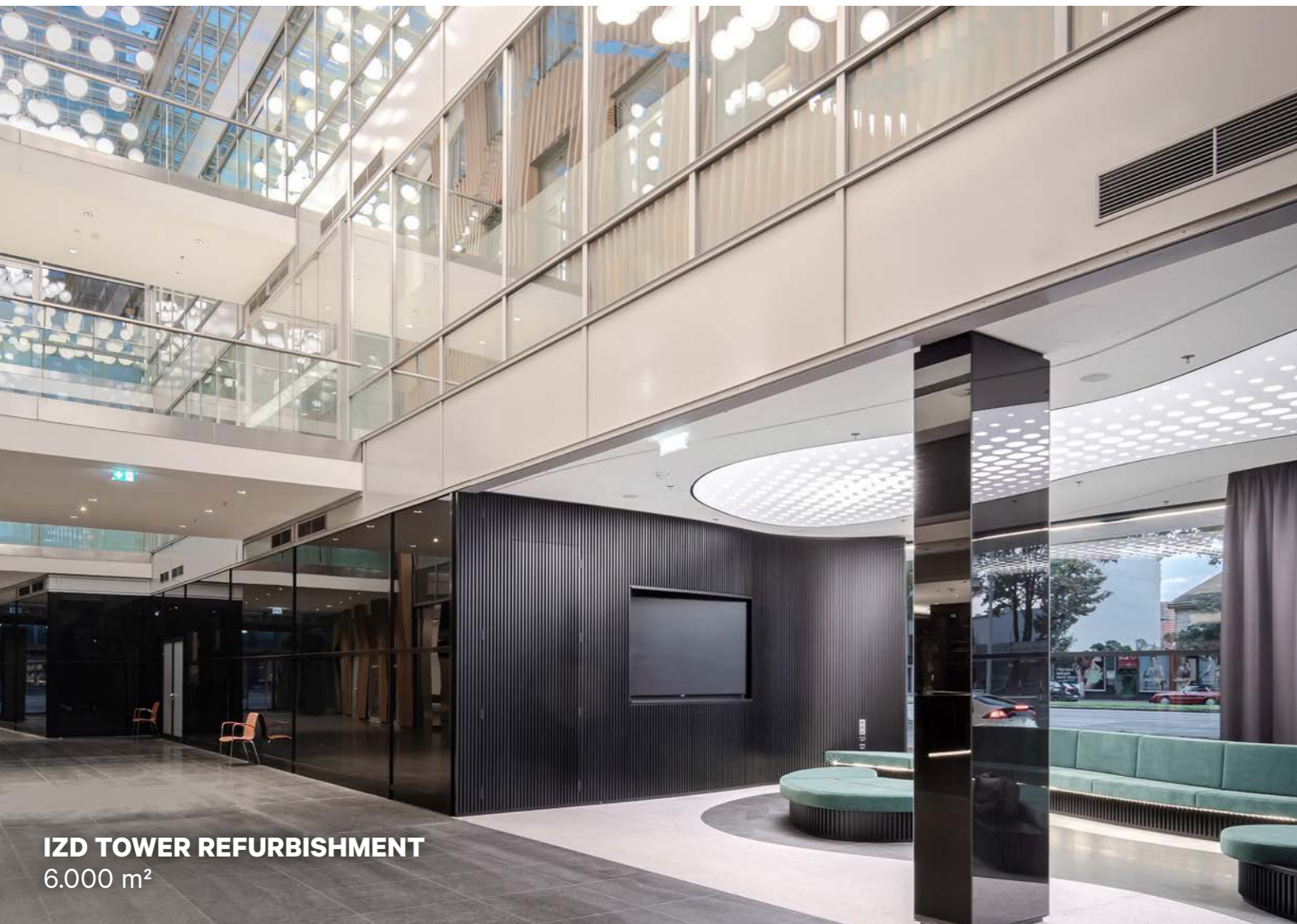
IZD TOWER REFURBISHMENT 6.000 m 2