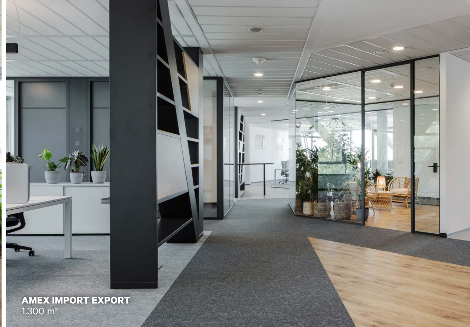
AMEX IMPORT EXPORT 1.300 m 2