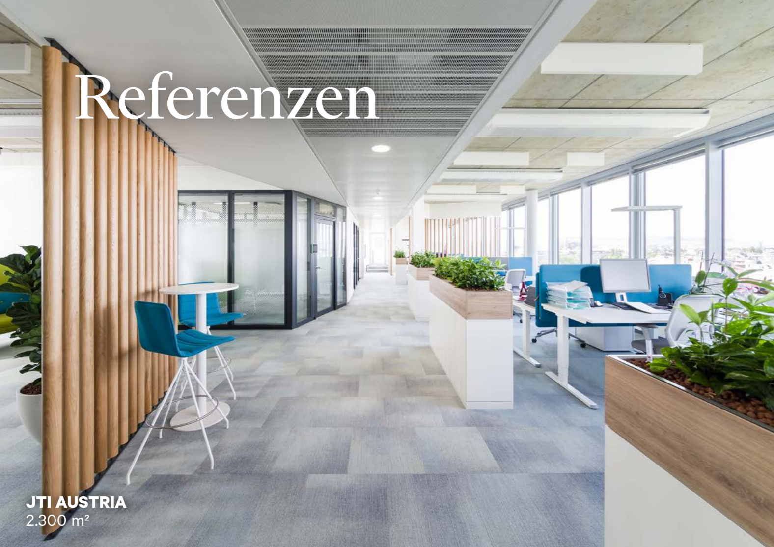
JTI AUSTRIA 2.300 m 2