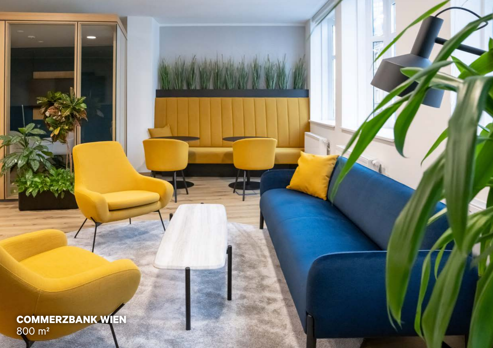
COMMERZBANK WIEN 800 m 2